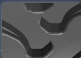
Breite, quer verlaufende Stollenköpfe Große Aufstandsfläche und verbesserter Bändersitz.