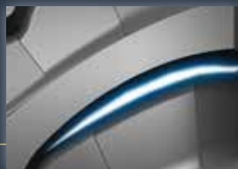
ProgressiveTraction® Hervorragende Traktion.