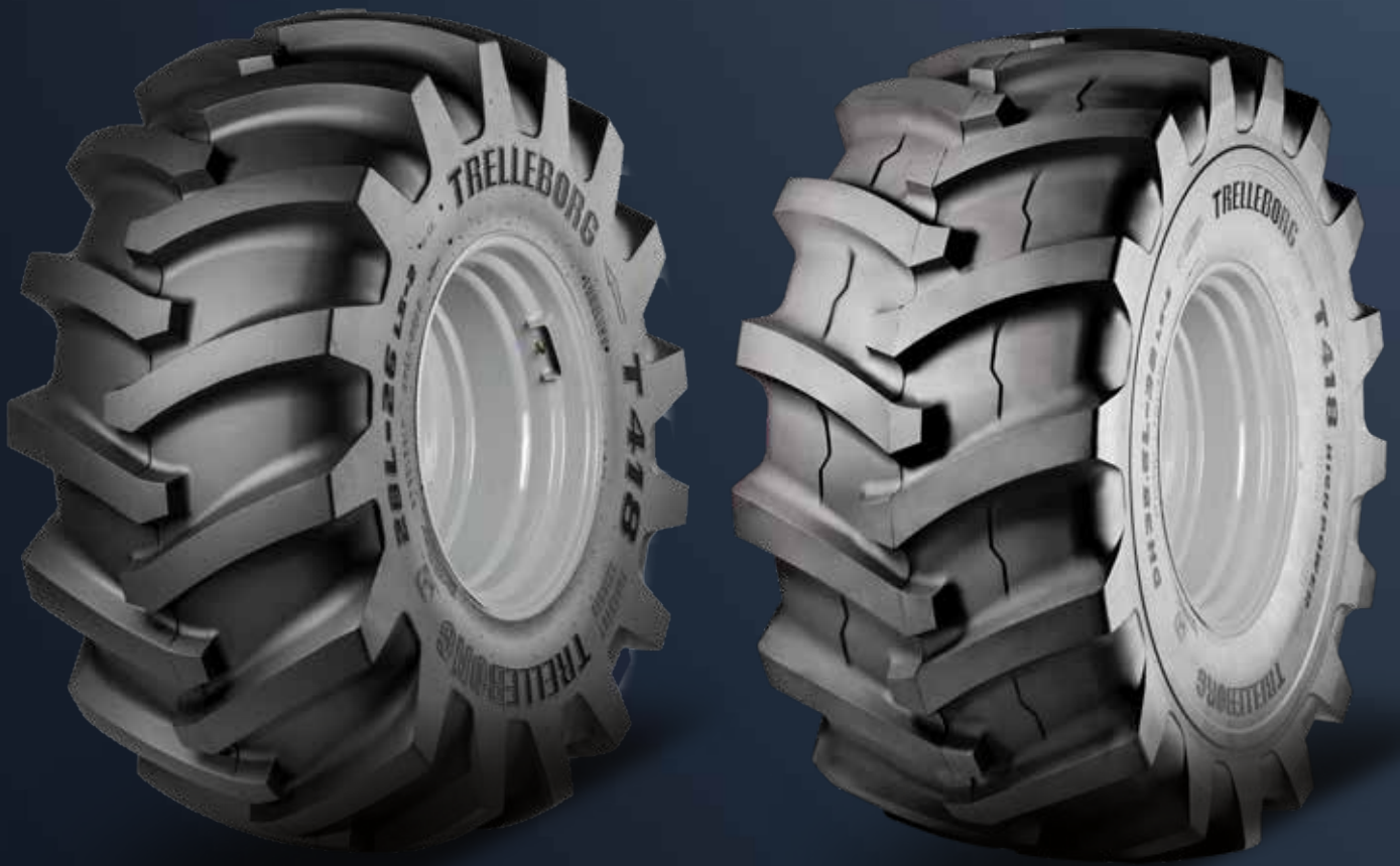
Forestry Skidder T418 High Power