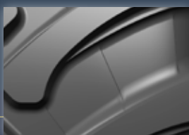
Schollenbrecherkanten Gute Selbstreinigung.