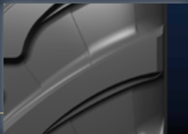
Breite Stollenschulter Gute seitliche Bänder-Stabilisierung und eine robuste Reifenschulter.