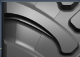
Stollenwinkel und -form Optimale Zugkraft und Geländegängigkeit.